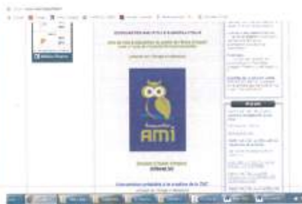
Site Internet Mairie de Marcilly-sur-tille (Capture d'écran)

Le 14 mai 2017, cet avis a été transmis au journal Le Bien public qui l'a publié le 16 mai 2017 (avis ci-dessous).