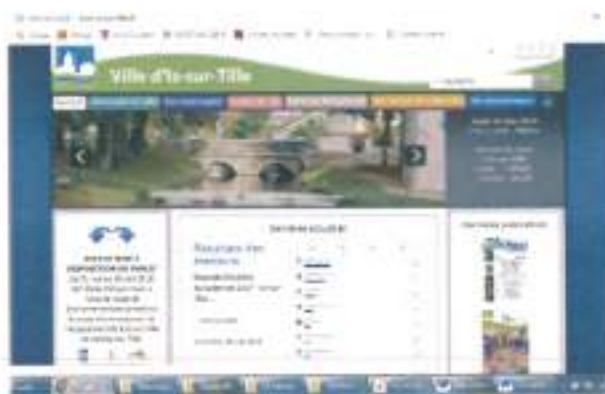
Site Internet Mairie d'Is-sur-tille (Capture d'écran)