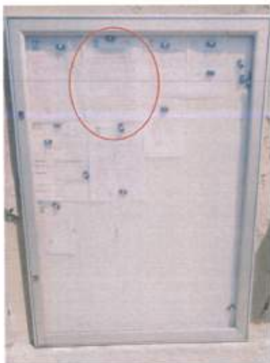
Panneau Mairie d'Is-sur-tille

Cet avis a été affiché en Mairie d'Is-sur-Tille, Marcilly-sur-Tille et au siège de la SPL Seuil de Bourgogne ainsi que sur les sites internet des deux communes à partir du 14 mai 2019 (photos et capture d'écran ci-dessous). Les certificats d'affichages sont en annexe du présent bilan.