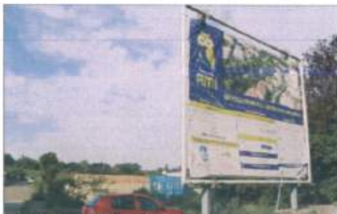
Le futur quartier AMI se dessine.

« Ceci concernant la dépollution, sont effectués quotidiennement. Ils seront au site toute l'année, jusqu'à ce qu'il soit possible d'amorçer l'aménagement du nou-