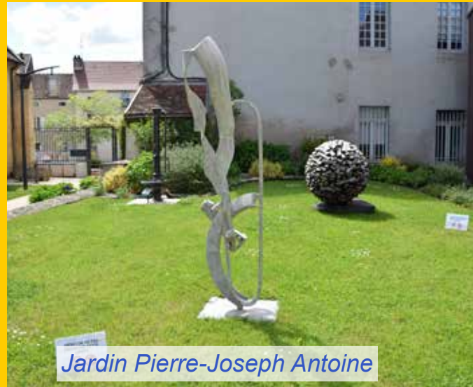
Jardin Pierre-Joseph Antoine