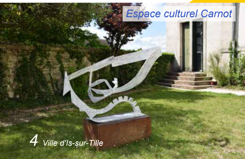
Espace culturel Carnot